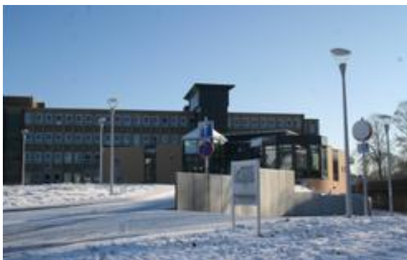
Maison de repos : CPAS Soignies