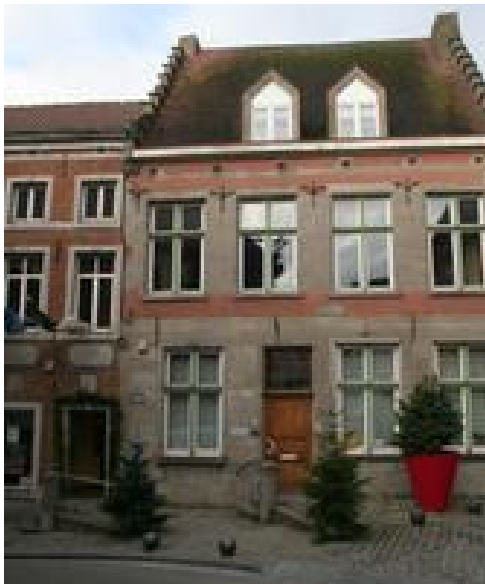
Bureau du CPAS

Certains veulent forcer cette fusion, revendication du MR. A Bruxelles, PS et CDH disent l'inverse de leurs collègues wallons...quelle incohérence !!!