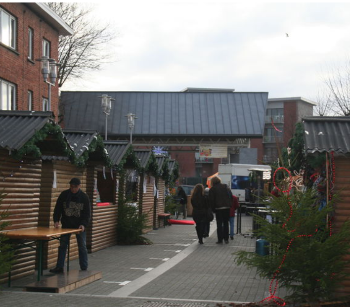
Marché de Noël 2014

Les finances de nombreuses communes sont au plus mal. Celles de Soignies faisaient exception mais cela ne semble plus être le cas. Ce budget ne prévoit aucune réelle anticipation et un fatalisme reportant la problématique sur les autres niveaux de pouvoir semble être la ligne de conduite de Soignies. Tous les graphiques alarmistes pour les prochaines années doivent, dès aujourd'hui, être moteurs d'un renouveau budgétaire. L'ensemble du budget doit être remis à plat. Non seulement pour les générations futures mais aussi pour retrouver des marges de manœuvre financières pour de nouveaux projets porteurs de rêve et adaptés à notre époque. Un budget passéiste qui est dans la lignée des deux dernières décennies; un budget passif sans anticipation. C'est le message que le groupe Ecolo a fait passer à l'assemblée par son abstention.